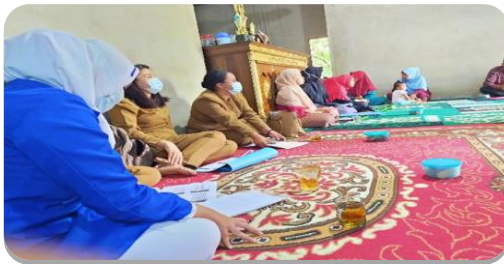
Menyusun rencana kegiatan