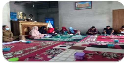
Pembukaan KKNT Luring