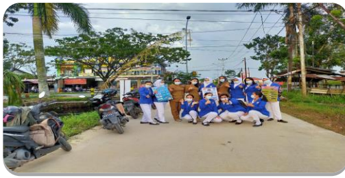
Survey Lapangan Di RT/RW 004/006

Metode yang digunakan adalah metode Luring yaitu pencegahan covid-19, sasaran masyarakat di RT/RW 004/005, Desa Arang Limbung, Kecamatan Sungai Raya, Kabupaten Kubu Raya. Capaian melakukan kegiatan selama 1 bulan dan tetap menggunakan protokol kesehatan. Adapun kegiatan adalah Survei lapangan, penyusunan rencana kegiatan, Pembukaan KKNT bersama ketua RT/RW, pendataan masyarakat dengan menggunakan aplikasi INARISK, pemasangan spanduk, pemasangan poster, edukasi, pembagian masker dan melakukan Asuhan Ibu hamil dengan hipertensi, kunjungan lansia, penyerahan plakat dan peta wilayah serta dilanjutkan dengan penutupan kegiatan KKNT.